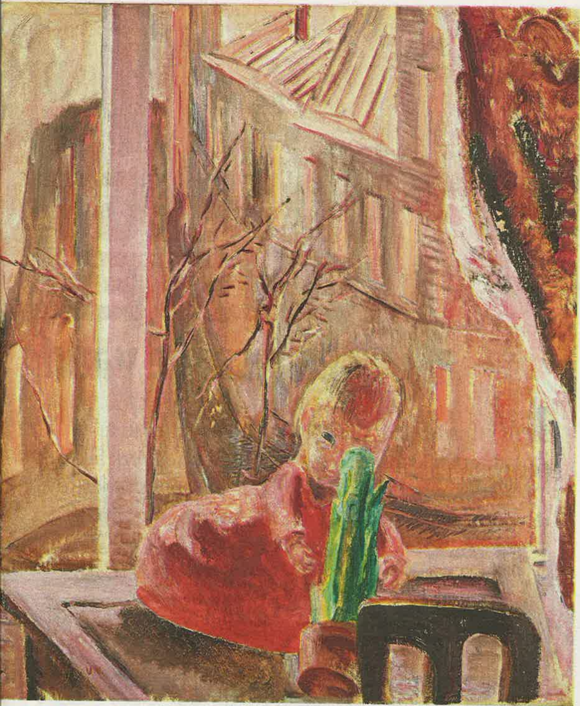
POJKE MED BLÅ MÖSSA. 1918, olja på duk, Jönköpings läns konstförening/Gannevikssamlingen.